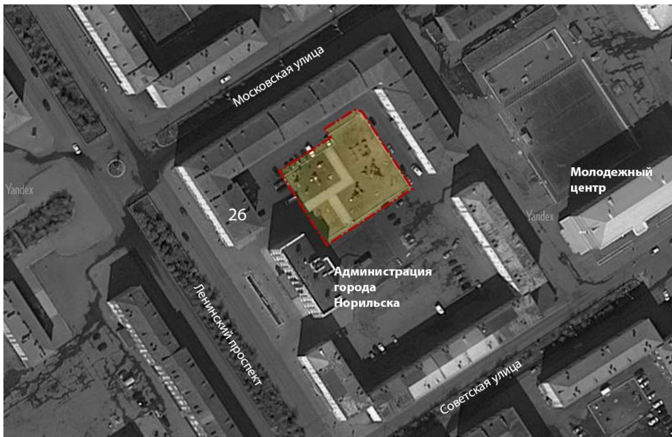
Схема №2. Границы территории