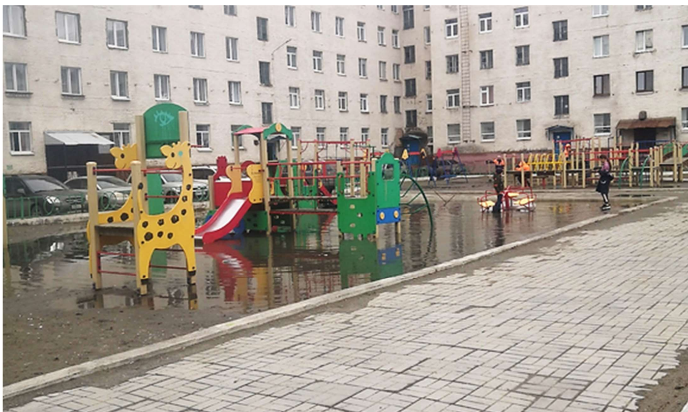
Фотофиксация текущего состояния общественной территории