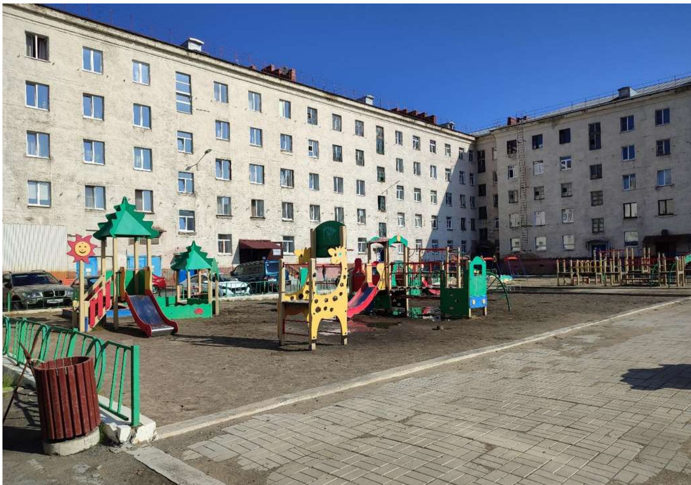
Фотофиксация текущего состояния общественной территории