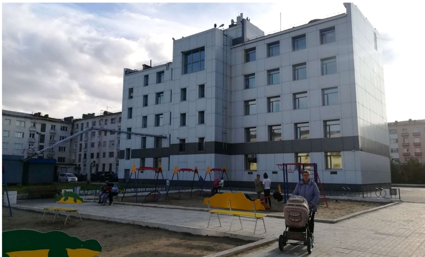
Фотофиксация текущего состояния общественной территории